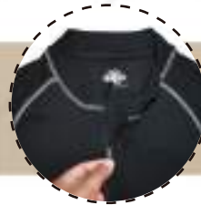
MEDIO CIERRE DELANTERO